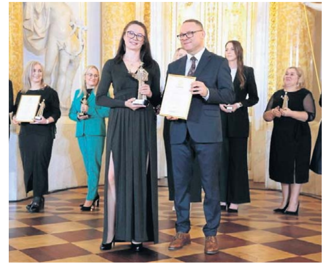
Nasza zwyciężczyni w kategorii Nauczyciel Roku

Przedszkole Niepubliczne Dom Małego Skrzata w Grudziądzu z Oddziałami Integracyjnymi i Specjalnymi (woj. kujawsko-pomorskie) zdobyło nagrodę w kategorii Przedszkole Roku. Placówką, która zdobyła II miejsce w tej kategorii, jest Przedszkole Niepubliczne nr 2 Brzozowy Lasek (Zgorzelec, Brzozowa 1, woj. dolnośląskie). Trzecie miejsce na podium kategorii Przedszkole Roku należy do Przedszkola Niepublicznego Pn. Ochronka Ducha Świętego (Sokołów Małopolski, Plebańska 6, woj. podkarpackie).