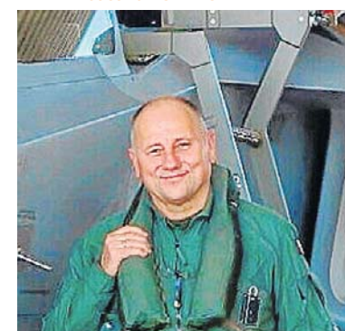
gen. bryg. pil. Waldemar Gołębiowski